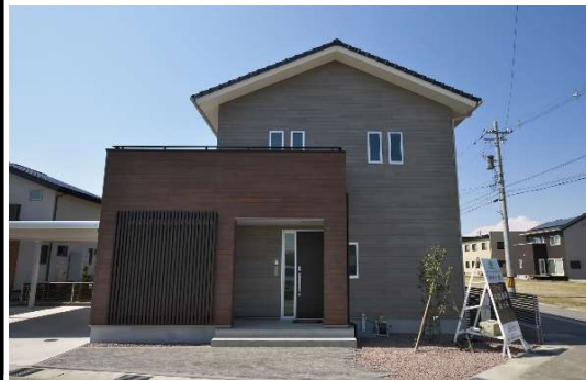
人気の婦中町上轡田に築7年の築浅物件！